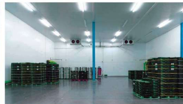
Chłodnia magazynowa Piotr i Paweł w Centrum Panattoni Park, Błonie-Pass.

Jesteśmy doświadczonym wykonawcą. Budujemy chłodnie, centra logistyczne i magazyny dla sieci supermarketów, zakładów mięsnych i mleczarni.